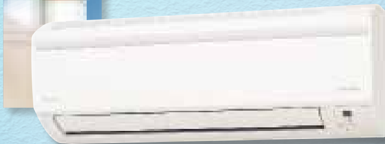
Beltéri egység FTX-JV/GV